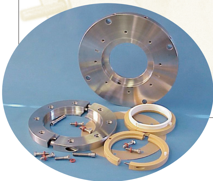
写真左：分割型AH Sシール