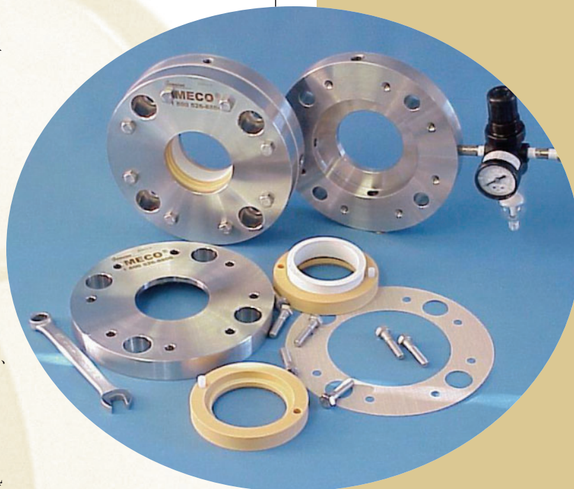
写真上：一体型AH Uシール

AH シリーズは低から中程度に摩耗性がある粉体材料が扱われる、リボンプレンダー、バケットコンベアー、スクリュウコンベア、反応装置、アジテーターなど攪拌機や搬送機のシールとしての用途に適しています。AH、APシリーズはまた、ベアリングの潤滑オイルの漏れ止めとして使われるリップシールの代わりとして用いられることもあり、また他のMECOシールが設置スペースの制約で使えないようなケースでも、コンパクトなデザインのこのシリーズがお役に立つことが多くあります。